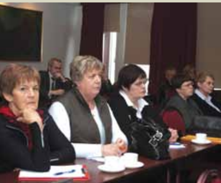
Frá opnum sjóðfélagafundi sem haldinn var á Akureyri.

Niðurstöður úttektarnefndar um starfsemi lífeyrissjóða hafa verið teknar til ítarlegrar umfjöllunar á stjórnarfundum í LSR, opnum sjóðfélagafundum í Reykjavík og á Akureyri og á fjölmörgum stéttarfélagafundum sjóðfélaga. Mest um vert er að nefndin staðfesti að lífeyrissjóðirnir hefðu farið að lögum og reglum í starfsemi sinni en kom með gagnlegar ábendingar og athugasemdir um hvar mætti gera enn betur í stjórnýslu og starfsemi sjóðanna. Sumt hefur nú þegar verið tekið til greina, til dæmis voru settar skýrari verklagsreglur er snerta ákvarðanir sem einungis sjóðsstjórn getur tekið og hvaða ákvarðanir framkvæmdastjóri getur tekið án þess að bera fyrst undir stjórn. Þá hafa kröfur um skilmála skuldabréfa verið hertar og ákveðið að færa ítarlegri fundargerðir um niðurstöður og ákvarðanir stjórnar og fjárfestingaráðs. LSR og LH voru með fyrstu lífeyrissjóðum landsins sem settu sér siðareglur. Ástæða þykir til að endurskoða þær og gera þær ítarlegri.