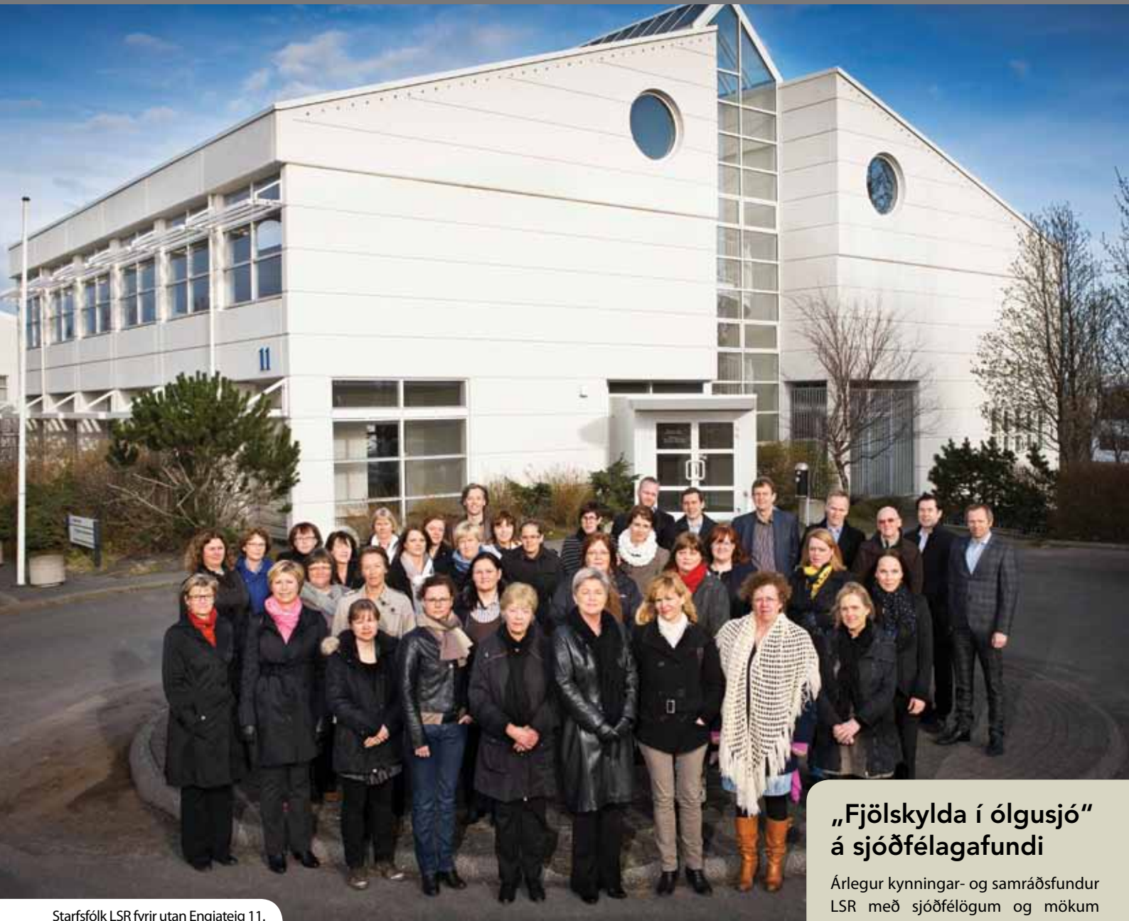
Starfsfólk LSR fyrir utan Engjateig 11.